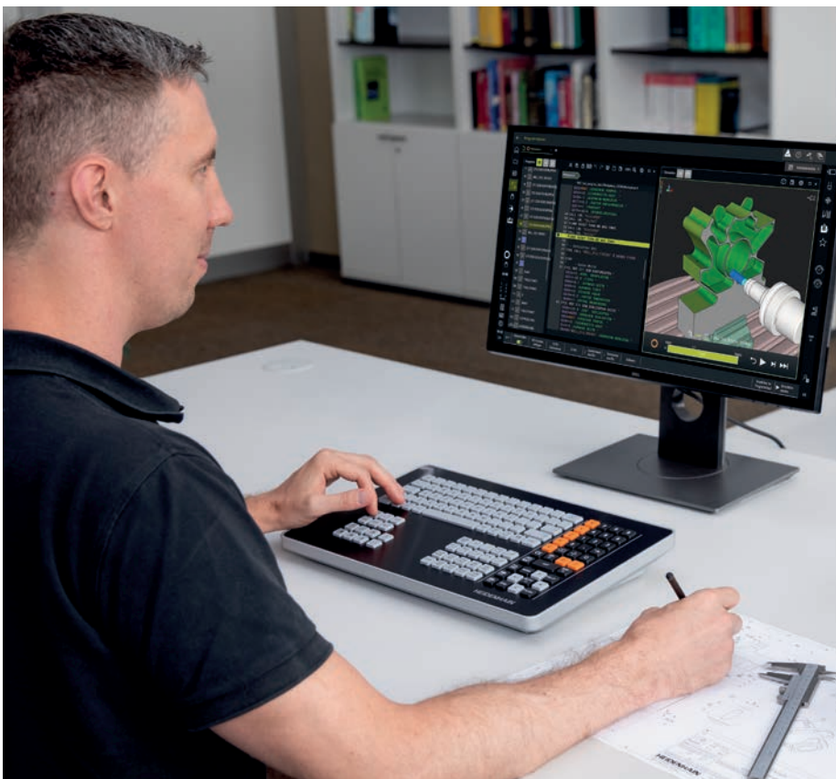
Tastiera della stazione di programmazione TNC7

Massima praticità: pressoché tutte le opzioni software a pagamento e – per iTNC 530 – le funzioni FCL sono disponibili a titolo gratuito sulle stazioni di programmazione TNC. Qualsiasi operatore che disponga della versione demo gratuita o della versione completa è in grado di testare tutte le funzioni e quindi decidere se optare per l'upgrade sulla macchina.